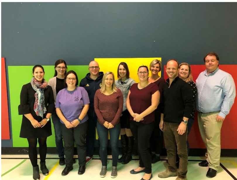
Photo des membres du conseil s'établissement 19-20